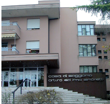
La casa di riposo "Simonetti" di Oderzo