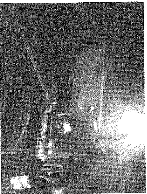
I pompieri al lavoro per spegnere le fiamme

► Alessandro Viezzer ► SAN POLO DI PIAVE